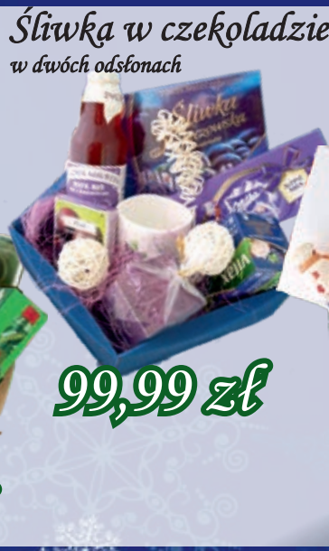
Śliwka w czekoladzie w dwóch odsłonach