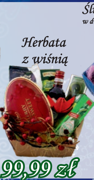
Herbata z wiśnią