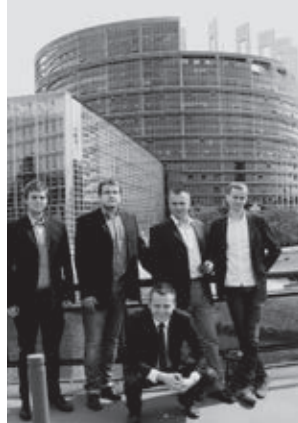
Przed PE w Brukseli