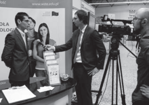
Podczas Targów Edukacyjnych w Krakowie