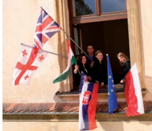
Studenci na Zamku Suskim