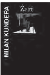
Kundera M.: Żart

Żart, nieco okrojony, wydany w Polsce w 1970, wzbudził wówczas duże zainteresowanie. Tytułowy żart-kartka wysłana do dziewczyny i odczytana jako kpina z ideologicznych świętości – całkowicie zmienił życie bohatera. W Żarcie jest już wszystko to, co najistotniejsze w pisarstwie Kundery: egzystencjonalna koncepcja sztuki powieści i tematy, którym pozostanie wierny także w swoich późniejszych utworach – tragiczny rozdzwięk między ciałem i duszą, seksem a miłością, bezradność wobec skutków własnych działań, motyw śmiechu i zapomnienia.