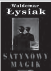
Łysiak W.: Satynowy magik

„Satynowy magik” to nowa rewelacyjna powieść Waldemara Łysiaka, będąca swoistym jego „Faustem”. Wyrafinowane Zło uwodzi prostoduszną Naiwność, czego finałem jest krwawa katastrofa.