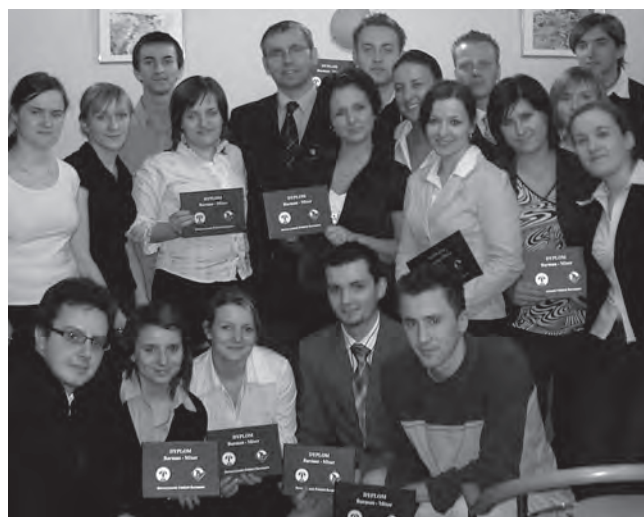
Uczestnicy kursu barmana

Szeroką ofertę szkoleń i kursów proponuje Wyższa Szkoła Turystyki i Ekologii w Suchej Beskidzkiej. Jest to propozycja skierowana zarówno do studentów uczelni, jak również do osób chcących podnieść swe zawodowe kwalifikacje.