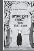
Chris Priestley Opowieści grozy wuja Mortimera

doskonałe, ale i w tych prawie doskonałych czasach czai się zło, które atakuje w straszny sposób, między innymi bliskich Uški. Nastolatka już wie, że rodzina jest najważniejsza i dla niej jest gotowa poświęcić wszystko. Czy jej się uda?