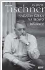
Tischner J.: Nadzieja czeka na słowo

filmowych: „Polowanie na muchy” i „Trzeba zabić tę miłość”, współautor scenariusza „Rejsu”. Autor sztuk teatralnych, laureat wielu nagród literackich. Jego ostatnia powieść „Goodnight, Dżerzi” wydana w 2010 roku, szybko stała się bestsellerem, a prawa do jej wydania kupili wydawcy z pięciu krajów.