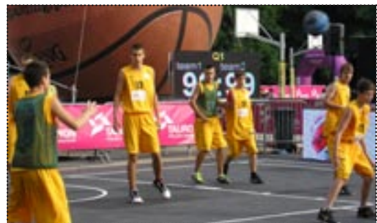
polskim zagrało łącznie 5500 dzieci w 549 drużynach.

Turniej „Orlik Basketmania” był rozgrywany na 36 „Orlikach” w pięciu województwach- podkarpackim, małopolskim, śląskim, opolskim i dolnośląskim. Ideą projektu była promocja wśród dzieci i młodzieży sportowej aktywności i zasad fair play, aktywizacja lokalnych społeczności oraz zachęta do wspólnego organizowania różnych działań sportowych na obiektach wybudowanych w ramach programu „Moje Boisko – ORLIK 2012”. Łącznie podczas eliminacji gminnych, wojewódzkich oraz na finale ogólnopolskim zagrało łącznie 5500 dzieci w 549 drużynach.