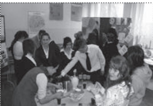
Językowcy prezentowali metody nauczania oraz tradycyjne potrawy i napoje Niemiec i Anglii