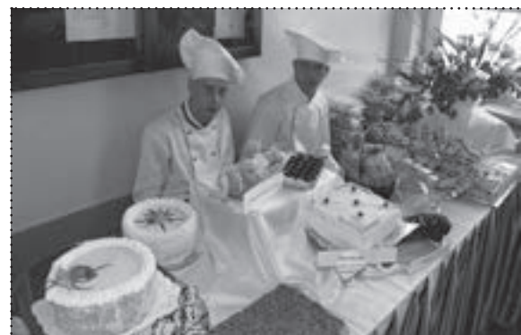
Cukiernicy i kucharze prezentują swoje wyroby