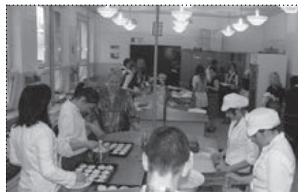
Można było podpatrzeć cykl produkcyjny i posmakować ciasteczek w kawiarence