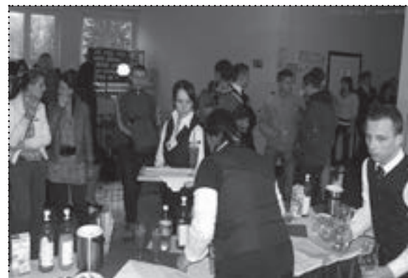
Pokaz barmański cieszył się dużym zainteresowaniem