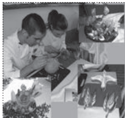
Pokaz umiejętności carvingowych-dekoracji warzywami i owocami