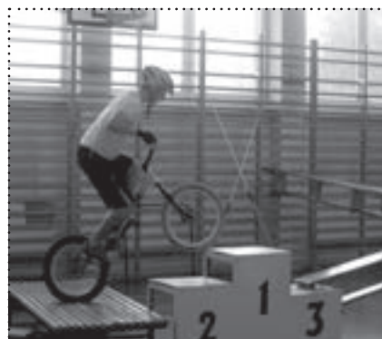
Prezentacja umiejętności sportowych uczniów