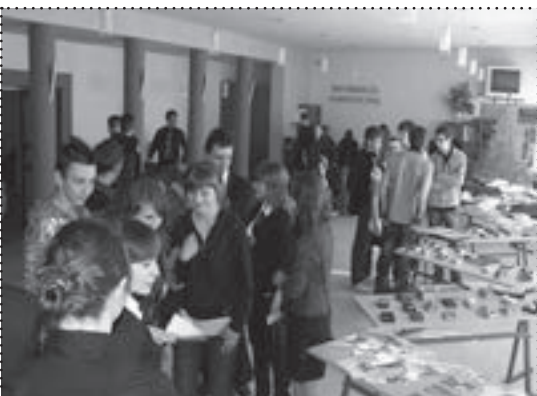
Gimnazjaliści licznie odwiedzają kierunki turystyczno-hotelarskie