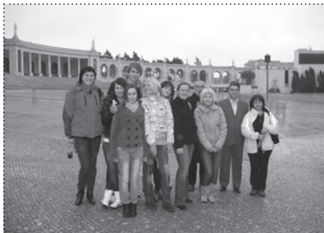
Zwiedzanie Sanktuarium w Fatimie