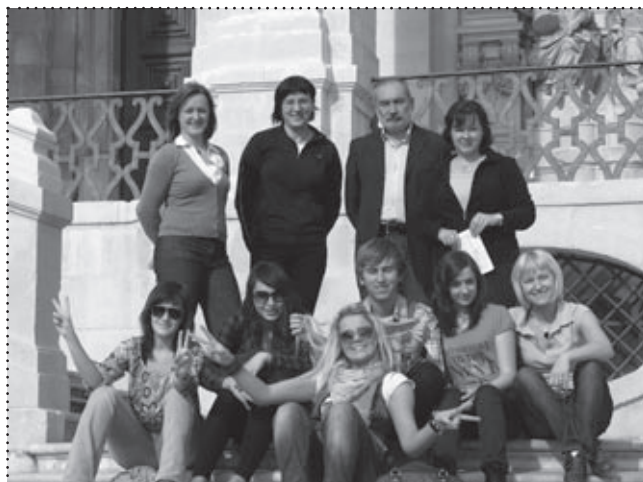
Na uniwersytecie w Coimbrze