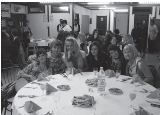
Lunch w portugalskiej szkole