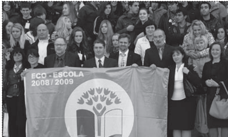
Oficjalne otwarcie i wciągnięcie na maszt flagi projektu