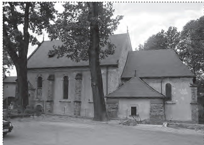
Widok na obiekt kościoła – stan przed renowacją