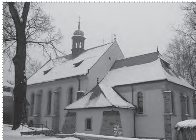
Widok na obiekt kościoła – stan obecny po renowacji