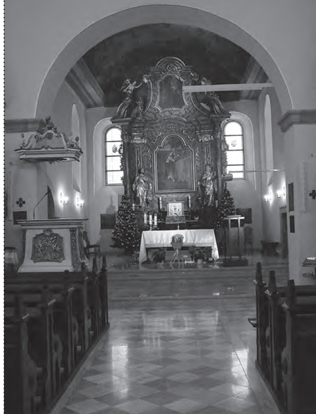
Wnętrze kościoła – stan obecny po renowacji

wilgoć, nieustannie wydobywająca się z jej przyziemia, nadal robiła swoje. Nikt wcześniej, pomimo wiadomego problemu nie odważył się na podjęcie odpowiednich prac ziemnych, które zniwelowałyby główne zagrożenie. Warto w tym miejscu wspomnieć, że z chwilą oddania do użytku nowej świątyni, stary kościół był stopniowo wyłączany ze swojej podstawowej funkcji. Fundatorzy nowego kościoła nosili się z zamiarem jego wyburzenia, uznając, że nowa, monumentalna neogotycka świątynia wystarczy do zapewnienia obsługi duszpasterskiej całej parafii. Na szczęście tak się nie stało.