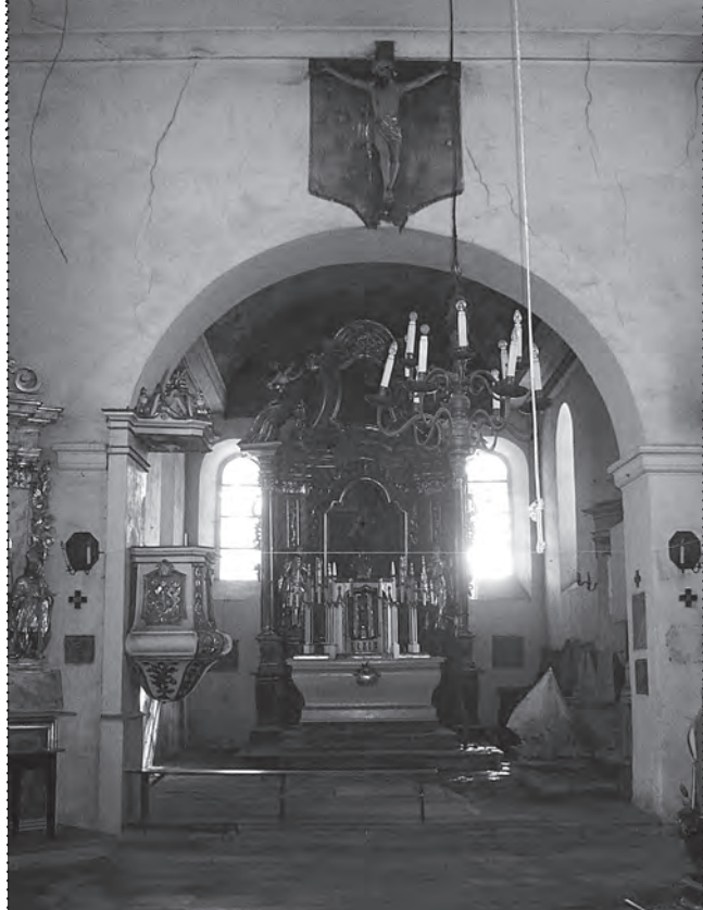
Wnętrze kościoła – stan przed renowacją