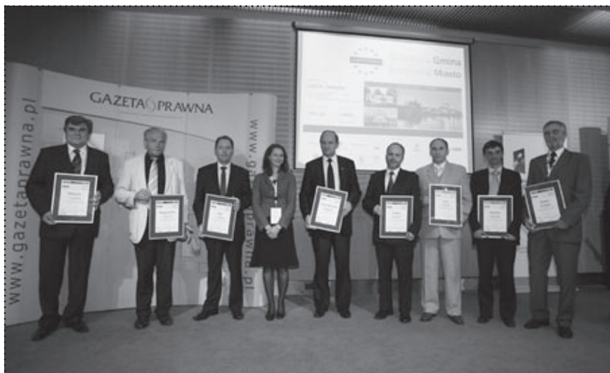
Laureaci rankingu z województw małopolskiego, świętokrzyskiego i podkarpackiego