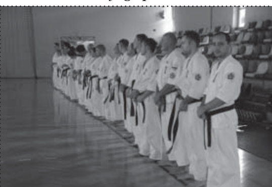
Wojownicy Seido Karate