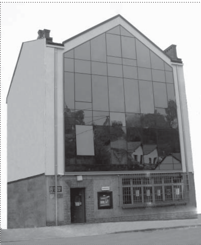
Odnowiony budynek Banku Spółdzielczego