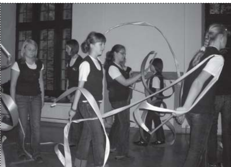
Koncert „Dzieci rodzicom” – Grupa rytmiczna