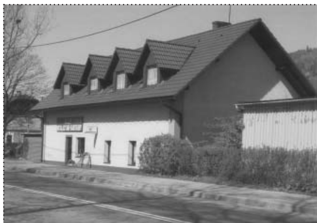
Harcówka do 1939 r., drużyn ZHP, żeńskich, Męskich i Gromad Zuchowych obecnie po przebudowie sklep z Armaturą Sanitarną, przy ul. Mickiewicza 60. Z prawej budynek Stacji PKP w Suchej Beskidzkiej.

Wnieśli oni wielki wkład okupiony ogromną ofiarą w odzyskaniu przez Polskę Niepodległości w 1918 roku. Harcerze zdali egzamin z bohaterstwa i patriotyzmu w walce z hitleryzmem w czasie okupacji niemieckiej w latach 1939-45, szczególnie w Powstaniu Warszawskim w 1944 roku. Lata po II - giej wojnie światowej za P.R.L -u nie były dla nich łaskawe. Obawiając się udziałów w konspiracji, wszelkimi sposobami likwidowano dorobek i zasługi Harcerstwa Polskiego, wprowadzając w 1948 roku Organizację Harcerstwa Polskiego na zasadach Leninowskich.