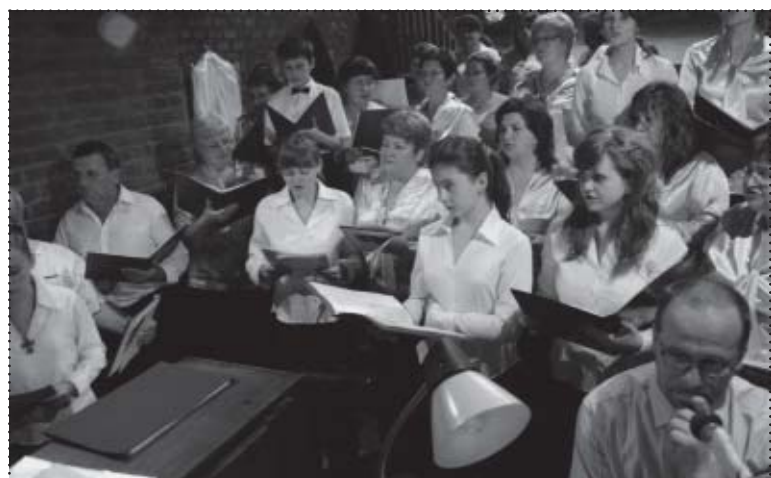
Połączone chóry JASIEŃ i Glissando Appassionato podczas obchodów 100-lecia poświęcenia nowego kościoła