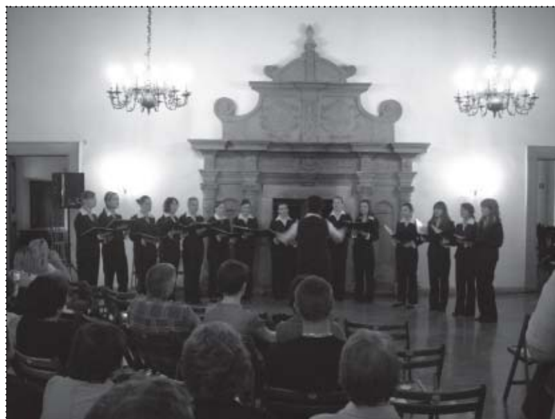
5 lat Glissando Appassionato