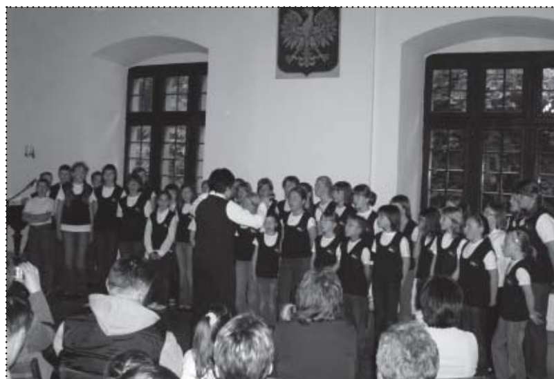
Magiczna Nuta podczas koncertu „Dzieci Rodzicom”