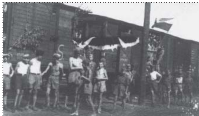
Załadunek do „Slipingu” na dworcu kolejowym w Suchej na wyjazd na obóz do Trzebieży.