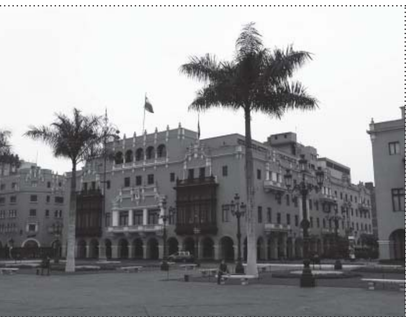
Zabudowa kolonialna w Limie przy Plaza de Armas - odpowiednik naszego rynku.

E: W Trujillo zdziwiły nas sklepy. Mianowicie wejście do sklepów było zakratowane. Podchodziło się do okienka, mówiło, co chce się kupić, płaciło się, po czym sprzedawca podawał towar. Wydawało nam się, że jest to przesadna ochrona przed złodziejami. Jednak mieszkańcy doskonale wiedzą, jak należy się zachowywać,