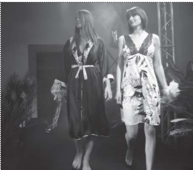
Pokaz bielizny daytime