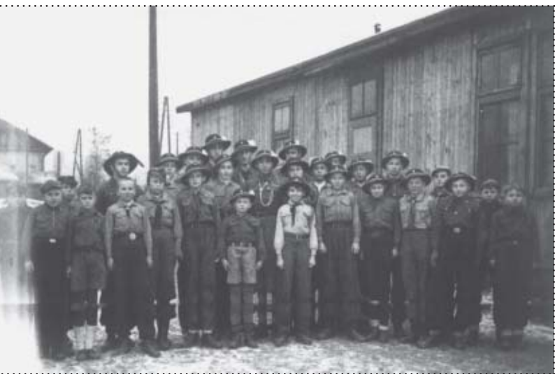
Drużyna Harcerzy im. Kr. Jana III Sobieskiego przed Świątlicą (barakiem) ZZK Sucha. (Jubasi i Janosiki)