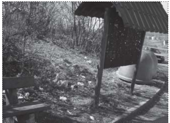
Takie miejsca w naszym mieście jeszcze się zdarzają

Segregacja śmieci to nie tylko ważna rzecz generująca dla budżetu domowego korzyści, to duża sprawa dla naszej gospodarki. Odzyskiwane materiały poddane kolejnej przeróbce przynoszą milionowe korzyści. Na to wpadły już dawno dalece zamożniejsze kraje niż Polska, a firmy przerabiające odpady prosperują od lat bardzo dobrze. To nie wszystko, segregując odpady zwiększamy okres używalności wysypisk. Musimy sobie przecież zdawać sprawę, że wszystko ma swój koniec. Wysypi-