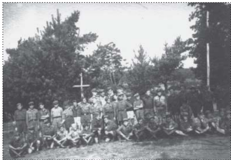
Podbufiec Harcerzy Sucha w 1948 r. na obozie w Trzebieży nad Zalewem Szczecińskim.