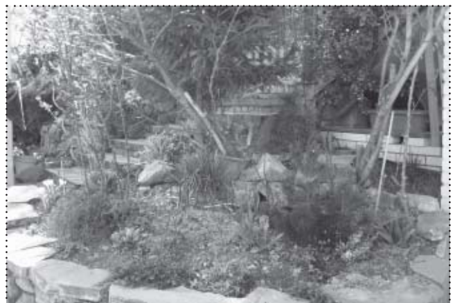
Ten ogród będzie cieszył oczy nie tylko właścicieli, ale i przechodniów.