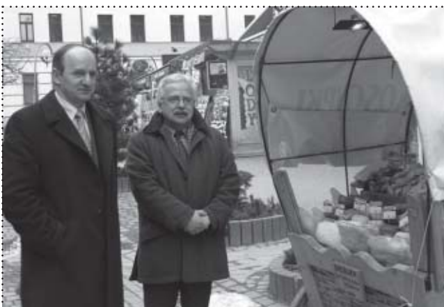
Stanisław Lichosyt pełniący obowiązki burmistrza Zakopanego.