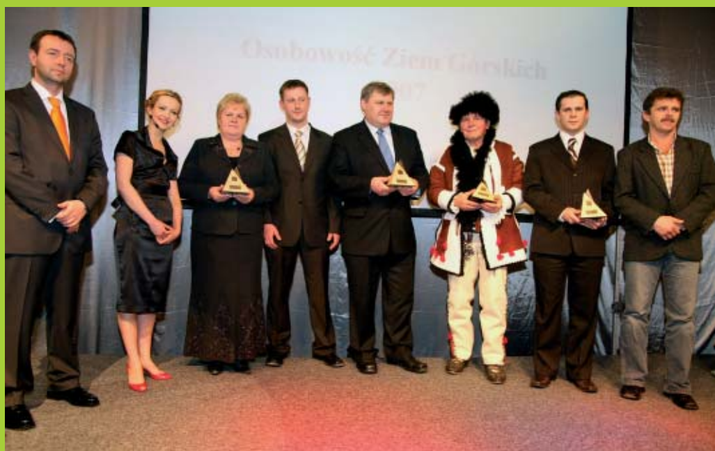
Zwycięzcy poszczególnych kategorii.