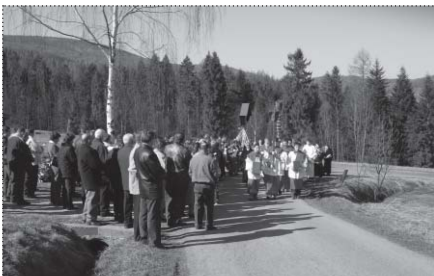
Procesja w Niedzielę Palmową „Do Krzyża” na Siwcowce.