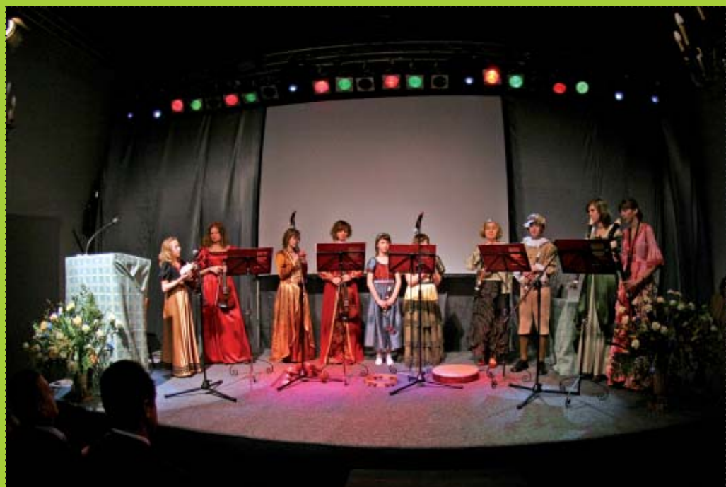
Gałą, swoim występem uświetnił Zespół Muzyki Dawnej im Gaspare Castiglione.