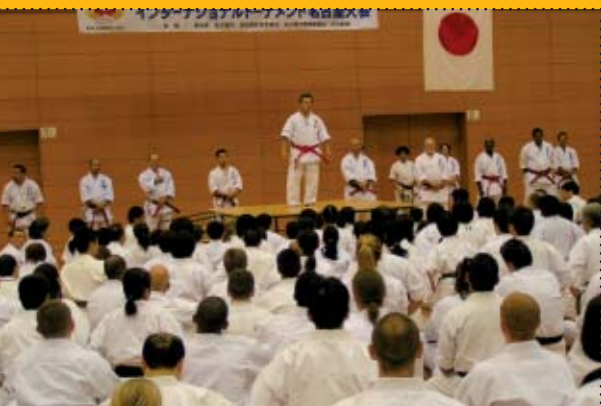
Trening czarnych pasów z Kaicho Nakamurą