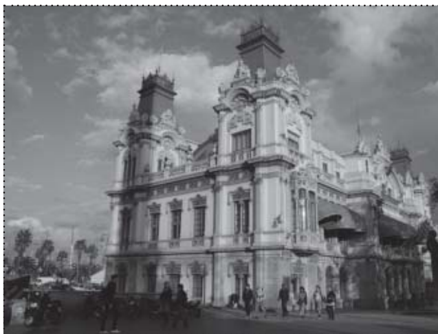
Barcelona – siedziba zarządu portu