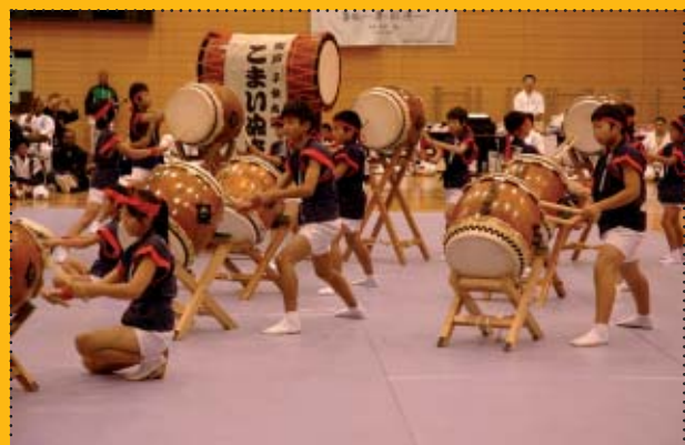
Uroczyste otwarcie MŚ