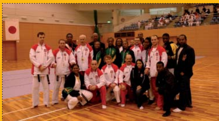
Reprezentacja Polski i Jamajki