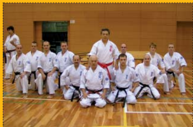
Reprezentacja Polski po treningu czarnych pasów