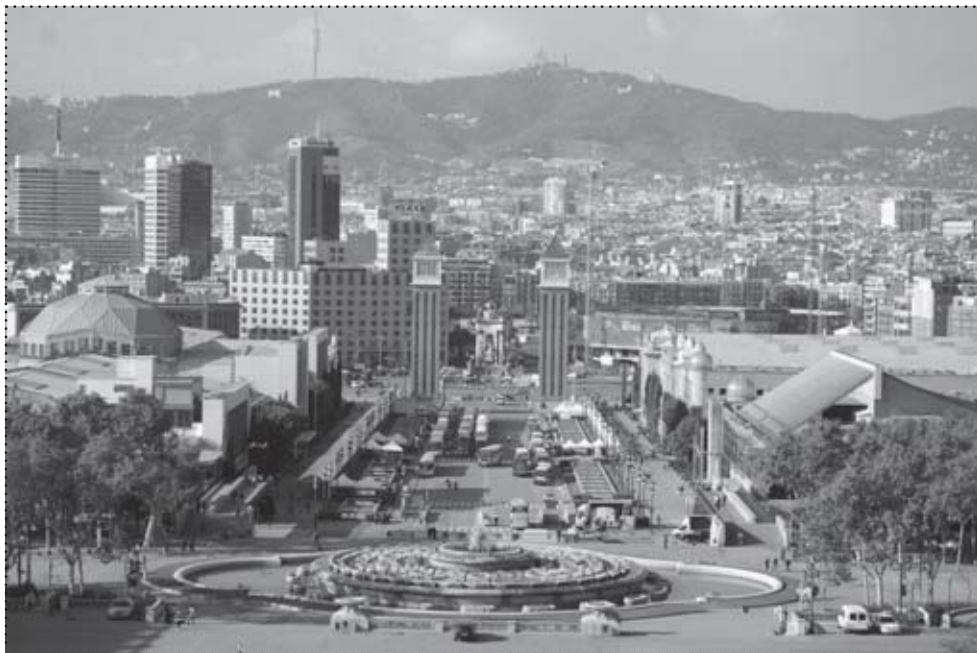
Barcelona – Plac Hiszpański

Dobrze, oderwijmy się teraz od kontynentu europejskiego. Wystartowaliście do pierwszego miasta na trasie waszej podróży. Było to Caracas w Wenezueli. Proszę opisać wrażenia z tak długiej podró-