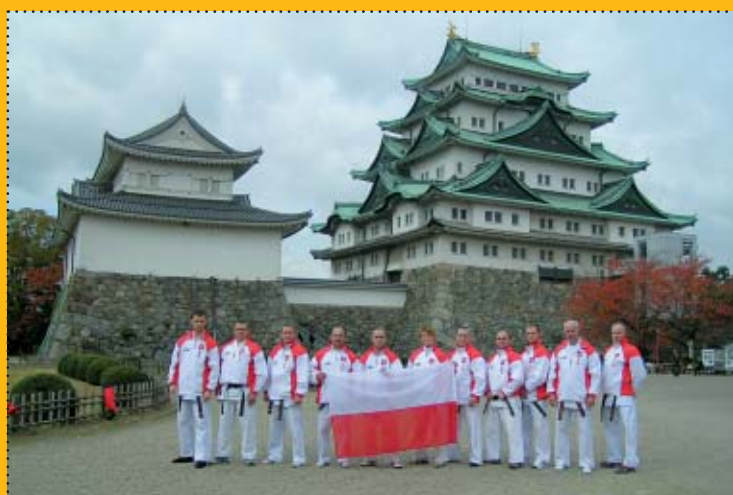
Reprezentacja Polskiej Federacji SEIDO KARATE