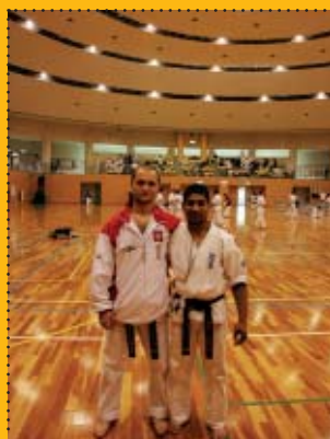
... i z reprezentantem Afryki Południowej