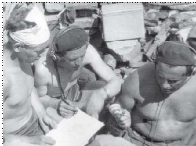
Archiwalne zdjęcia z 1957 r. SP9KBH – Pierwsze łączności z Babiej Góry.

„...Na szczyt wracamy po 4 nieodżałowanych godzinach. Widok, jaki oglądamy jest mało pocieszający. Maszt