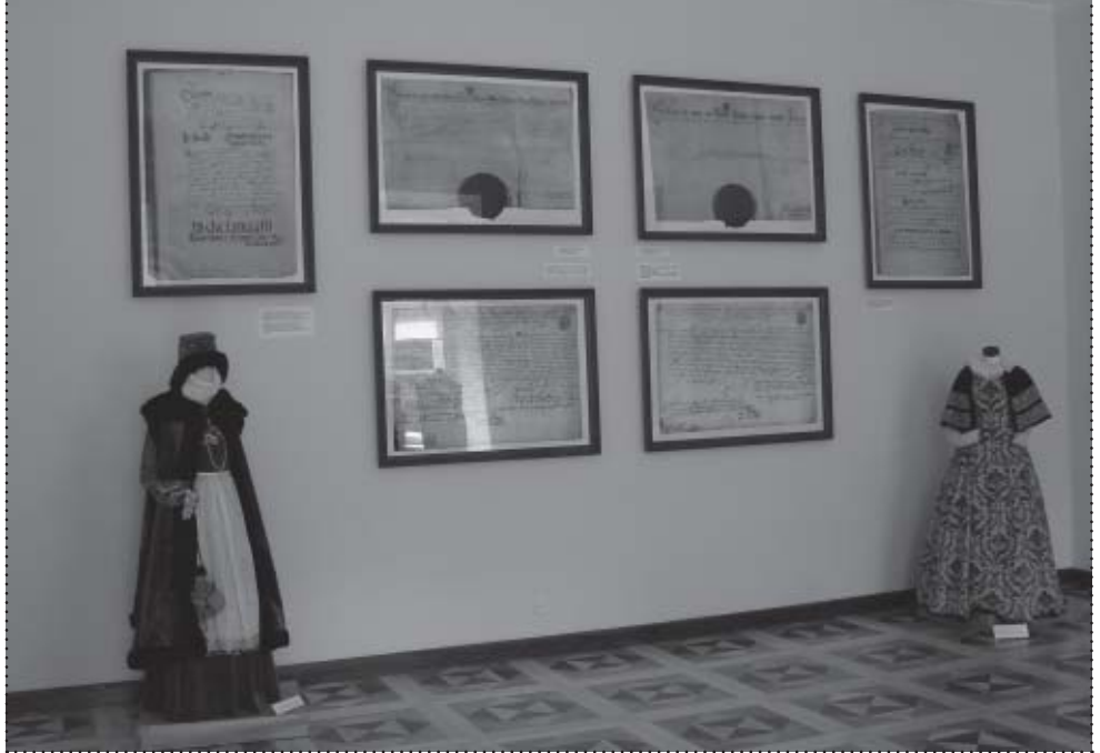
Dokument lokacyjny Suchej oraz przywileje targowe