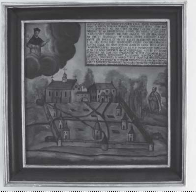
Wotywny obraz fundacyjny Parafii Suskiej z 1630 r.