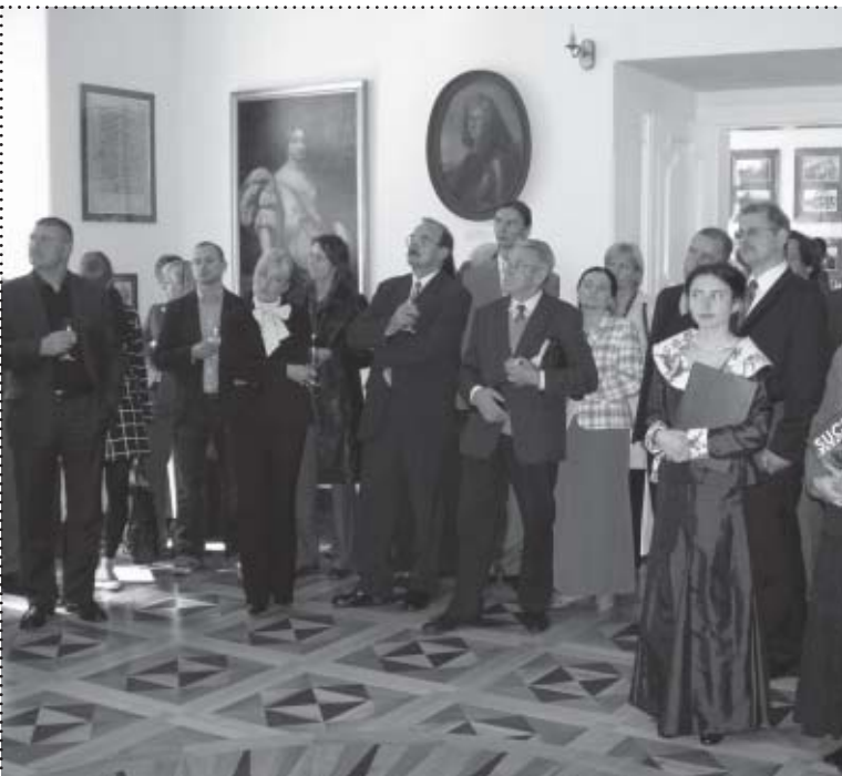
Zaproszeni goście w sali wystawowej Muzeum