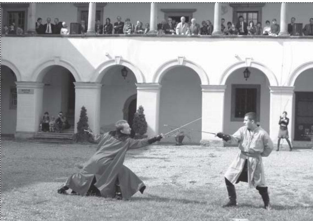
Pokaz dawnych technik walk w wykonaniu Szkoły Fechtunku „Aramis” z Krakowa

Muzeum Miejskie Suskiej Beskidzkiej można zwiedzać we wszystkie dni tygodnia z wyjątkiem poniedziałków.