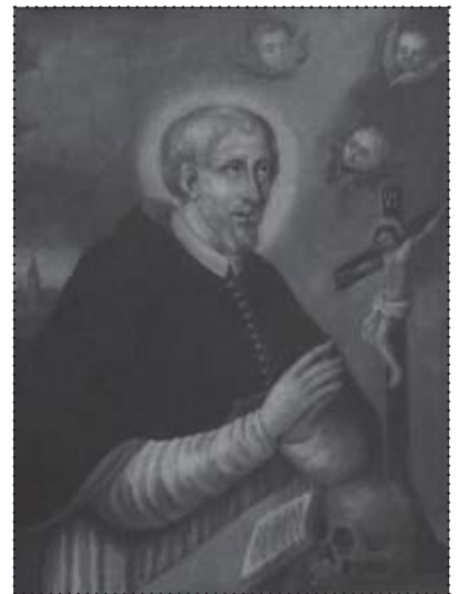
Sw. Stanisław Kazimierz (1580 r.)