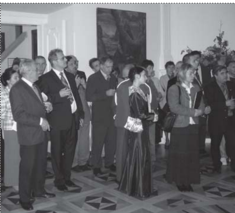
Sala wystawowa – Goście podczas prezentacji