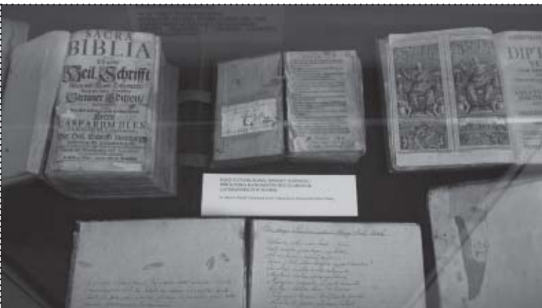
Książki z Biblioteki Kanoników Regularnych, ze zbiorów Parafii Suskiej