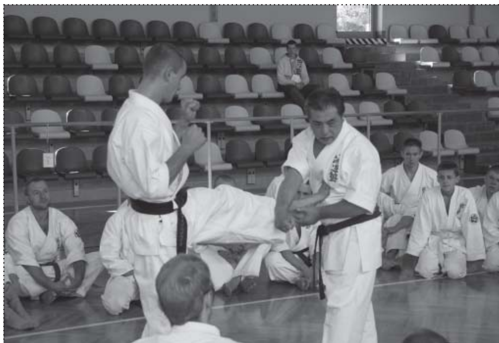
Kaicho podczas treningu – Wadowice, październik 2006.

World Seido Karate Organization zostało założone 15 października 1976 roku w Nowym Jorku. Popularność i uznanie Kaicho szybko rosła i to nie tylko w USA, tym bardziej, że był uznanym mistrzem jeszcze działając w strukturach Kyokushin. Tak więc także SEIDO zdobywało coraz większy prestiż w obu Amerykach a także na innych kontynentach. Swoją organizację Kaicho oparł głównie na instruktorach, którzy razem z nim