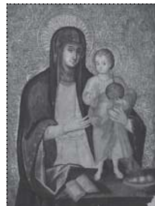
Hodegatria „Matka Boska Jagodna”, XVI w., ze zbiorów Parafii Suskiej