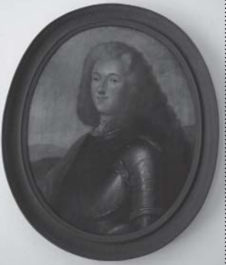
Portret Krzysztofa Komorowskiego (1647 r.)