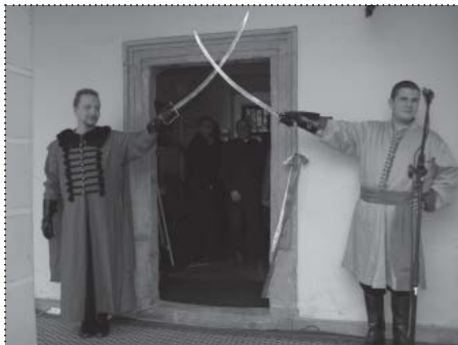
Członkowie Szkoły Fechtunku „Aramis” z Krakowa