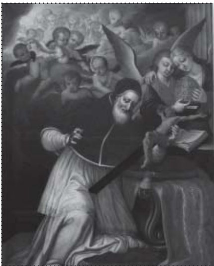
Adoracja krzyża przez Papieża Piusa V, XVII w., ze zbiorów Ireneusza Seneckiego