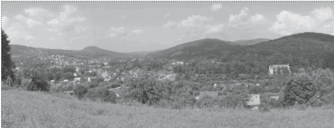
fol. J. Sobala