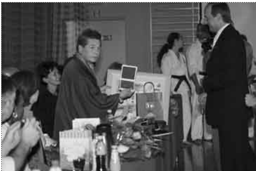
Obraz i pamiątkowy medal wręczony Mistrzowi przez Burmistrza Miasta Sucha Beskidzka