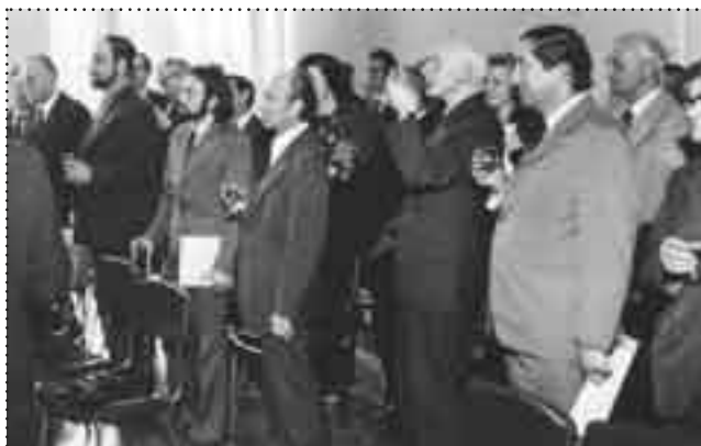
W dniu 6 czerwca 1975 roku odbyła się w Zamku uroczysta sesja Miejskiej Rady Narodowej z udziałem wojewody, posłów oraz wielu znakomitych gości, na której nastąpiło przekazanie tego obiektu Państwowym Zbiorom na Wawelu.