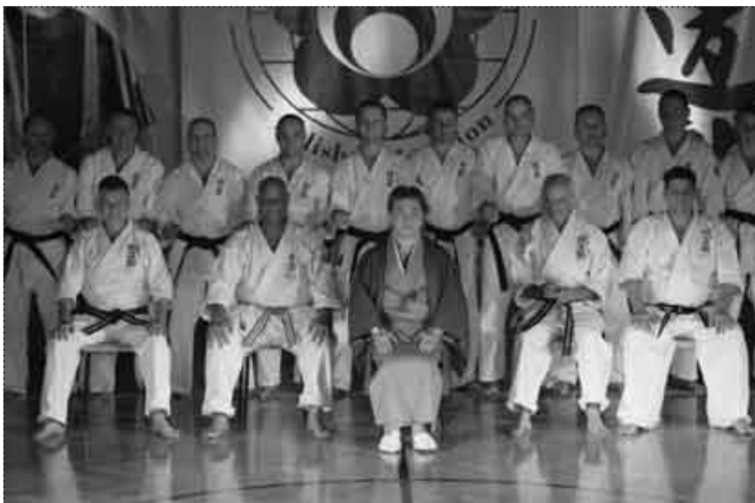
Mistrz ze swoimi studentami

Egzamin rozpoczął się pierwszego dnia zgrupowania a zakończył w dniu ostatnim wręceniem przez Kaicho czarnych pasów. Sobota była dniem, w którym instruktorzy przystąpili do sprawdzianu techniki, kata, kihon kumite, yakusoku kumite, kumite i całości programu technicznego wymaganego w Seido. Zawierał wiele elementów, z których najciekawszym był test technik z zawiązanymi oczyma. W trakcie tego testu zdający udali się do centrum miasta, gdzie także odbywał się egzamin. Zawiazane oczy? Dlaczego? - to test pomagający więcej zrozumieć! Codziennie, korzystając z wszystkich zmysłów jakie posiadamy, z wielu zjawisk nie zdajemy sobie sprawy. Wszystko wydaje się nam normalne i natu-