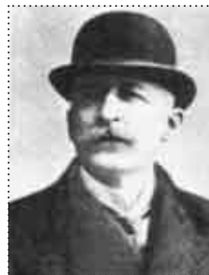
Dr Hugon Zapałowicz