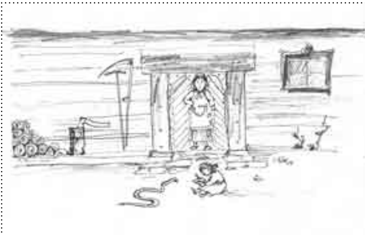
rys. Krzysztof Madoń

A przeczuwając swój okrutny los, gad niepostrzeżenie opuścił swoje leże. Rozebrawszy podgródkę, gada nie napotkali, przepadł w ziemskich czeluściach. Tylko pod jednym z okrytych