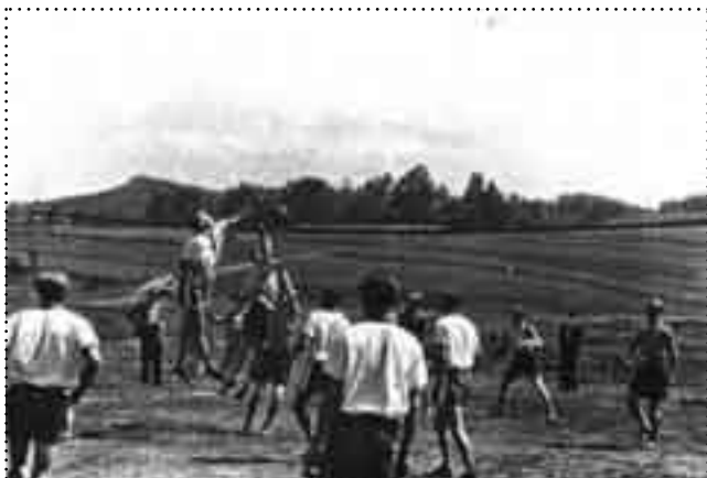
Mecz siatkówki na dawnym placu Sokolskim /dziś stoją tu 3 bloki/, u góry widoczny cmentarz

Zdjęcia wykonane już po II wojnie światowej, w 1948 roku