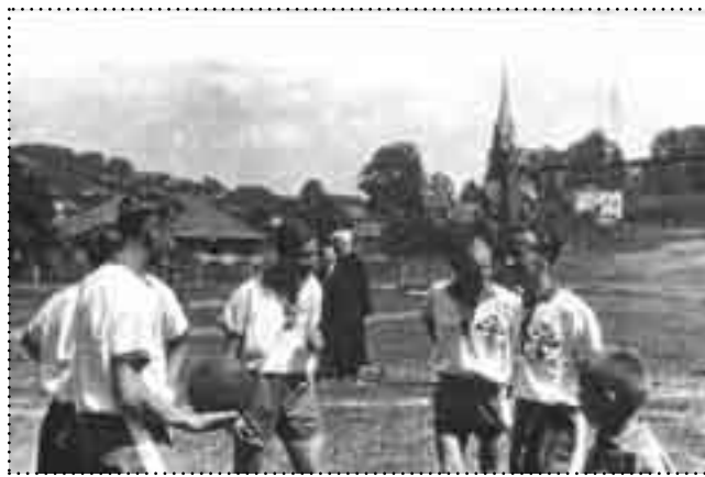
Na tym zdjęciu widoczna wolna przestrzeń na ul. Kościelnej