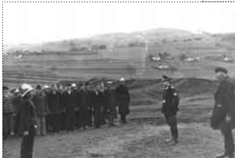
Okres okupacji. Odprawa Ochotniczej Straży Pożarnej na Placu Sokolskim. W głębi widoczna grobla Stawu Sokolskiego

to jedyny w tym rejonie przyzwoity budynek, znajdujący się w parku i należący do hrabiego. Upewnia mnie jednak w tym nie tylko stan ówczesnej zabudowy, ale fragment listu Marii Konopnickiej, w którym pisze: ...przez okno widzę na wprost cmentarz, a po prawej stronie ruiny huty . Faktycznie, cmentarz z okna tego budynku z uwagi na wolną przestrzeń widoczny był jak na dłoni, a ruiny huty szkła (bo o nią chodzi) znajdowały się tuż przy grobli stawu Sokolskiego. Było to mniej więcej w miejscu, gdzie obecnie znajdują się budynki (baraki) obok kortów tenisowych. Pamiętam jeszcze resztki fundamentów huty, zarośnięte trawą i pokrzywami.