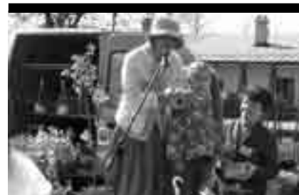
W trakcie oglądania wystawy, można było wziąć udział w licznych konkursach.

doniczkowych, krzewów, a także dobrej jakości sprzęt ogrodniczy. Można było również wyrażać swoje opinie na temat poszczególnych stoisk, głosując na swojego faworyta w konkursie na „Stoisko roku”. Dzieci i młodzież chętnie brały udział w konkursie rysunkowym „Mój ulubiony kwiat”, który niewątpliwie urozmaicił i przyozdobił tegoroczną wystawę. Wśród zaprezentowanych krzewów, największą popularnością cieszyło się