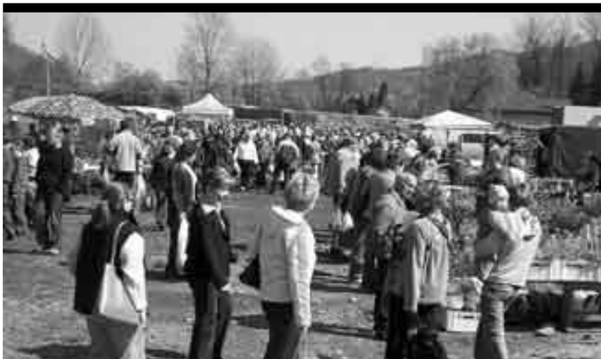
Można było zobaczyć, zapytać i kupić...