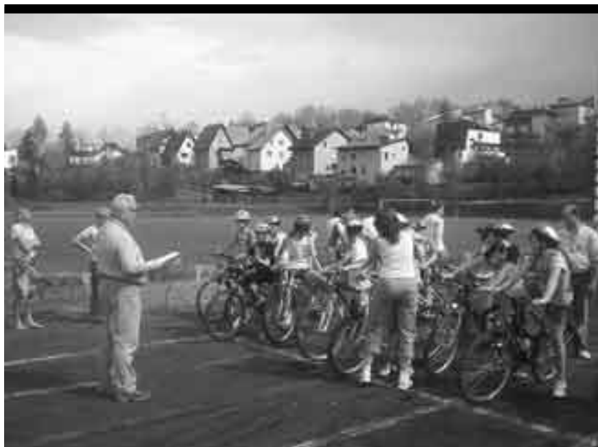
Dzieci potraktowały rajd przede wszystkim jako dobrą zabawę.