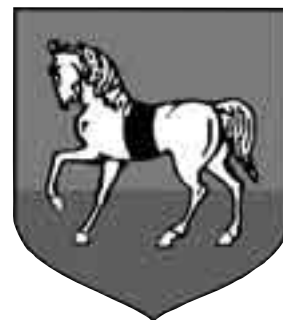
Herb Wielopolskich Starykoń Herb Miasta Sucha Beskidzka

rytuale odstępował od transakcji i biada jak miał słabe nogi, bo wówczas w ruch szły bity, a nawet kłonicie i orczyki (sic!).