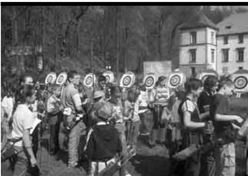
W zawodach łuczniczych wystartowało stu dziesięciu zawodników z siedmiu klubów województw małopolskiego i śląskiego.