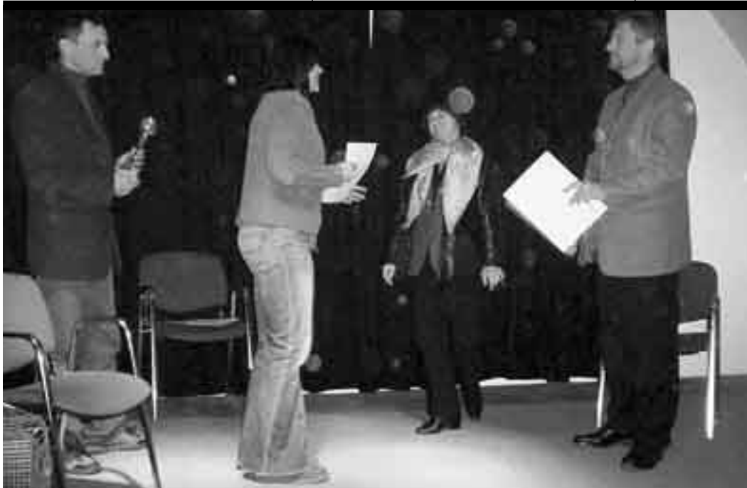
Grupa Plum – Bum z MOK w Suchej Beskidzkiej, zajęła w tym roku drugie miejsce.

Po konkursie jurorzy udzielili wielu ciekawych i przydatnych rad wszystkim uczestnikom i ich opiekunom.