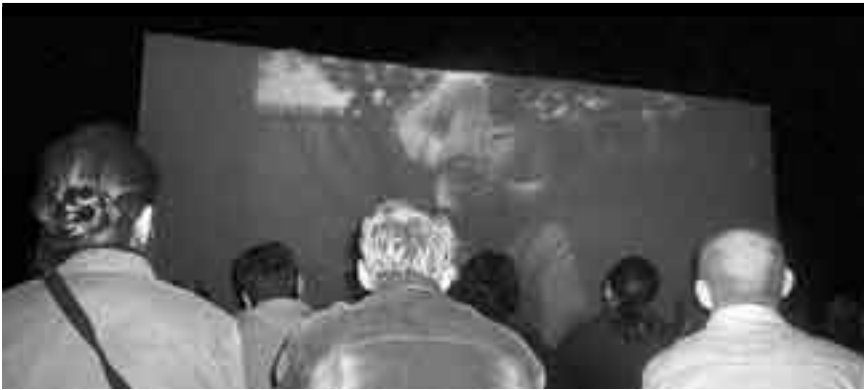
Publiczność zatęskniła za dawnym kinem.

utworów – swoimi gromkimi brawami – dała do zrozumienia organizatorom, że ten punkt w programie był prawdzi-