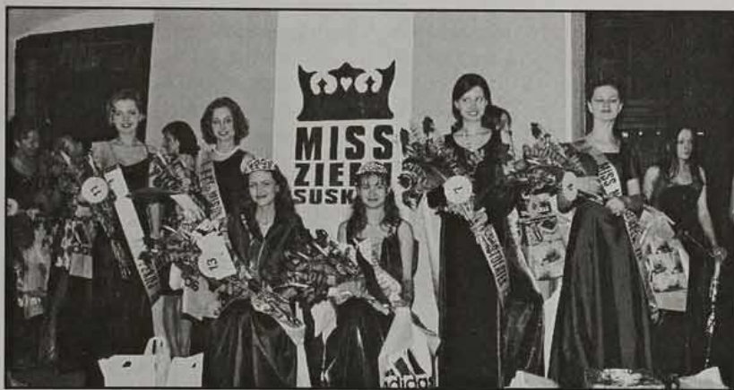
Laureatki wyborów Miss Ziemi Suskiej