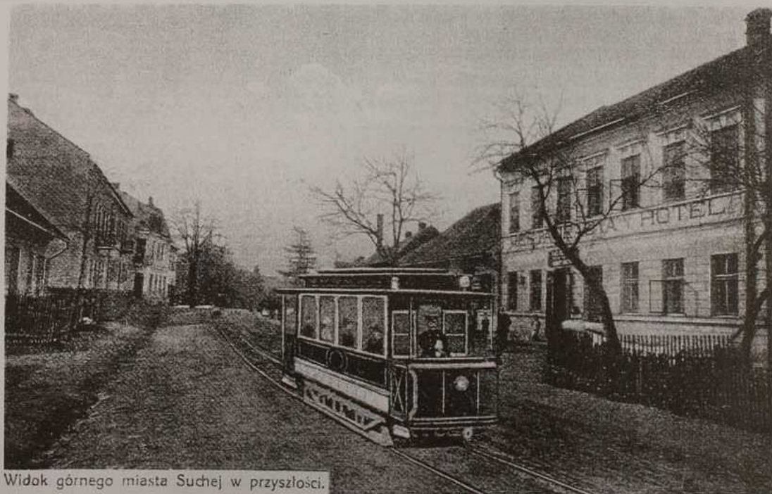
Widok górnego miasta Suchej w przyszłości.