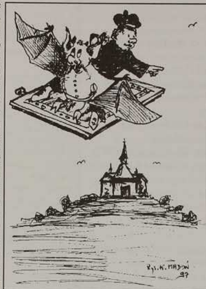
Kartka ze starego albumu