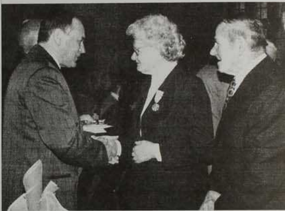
Zdjęcia Jubilatów są do odebrania w zakładzie fotograficznym p.B.Boni

Z tej okazji Prezydent Rzeczypospolitej nadał 24 parom małżeńskim - medale „za długoletnie pożyte małżeńskie”. Pod-