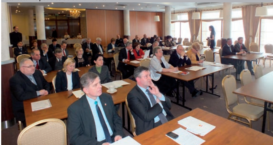
Starostowie podczas obrad konwentu

W przerwach w obradach konwentu zaproszeni goście mieli okazję zapoznać się z prezentacją zbiorów Beskidzkiego Centrum Zabawki Drewnianej w Stryszawie, przygotowaną i obsługiwaną przez pracowników miejscowego Gminnego Ośrodka Kultury, a także otrzymać materiały promocyjne powiatu suskiego i gminy Stryszawa.