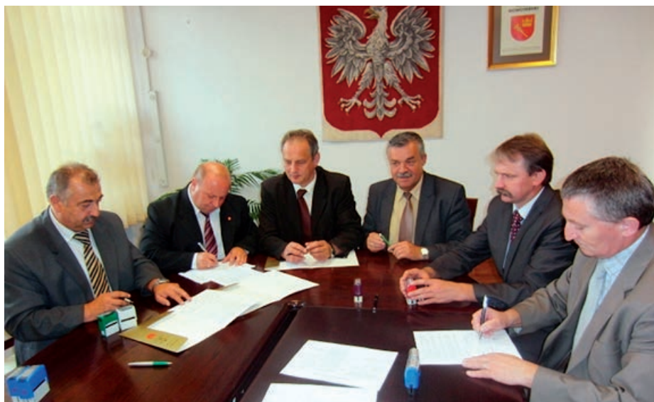
Starostowie powiatów subregionu podhalańskiego podpisują listy intencyjne dotyczące realizacji wspólnych przedsięwzięć.

Projekt stanowił będzie kontynuację reali-