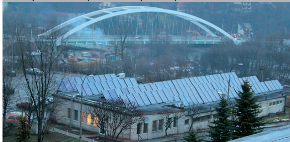
Kolektory słoneczne na budynku ZOZ w Suchej Beskidzkiej

W celu zapewnienia pełnej informacji na temat projektu utworzono odrębną stronę internetową www.solary.powiatsuski.pl , która jest na bieżąco aktualizowana przez pracowników wydziału.