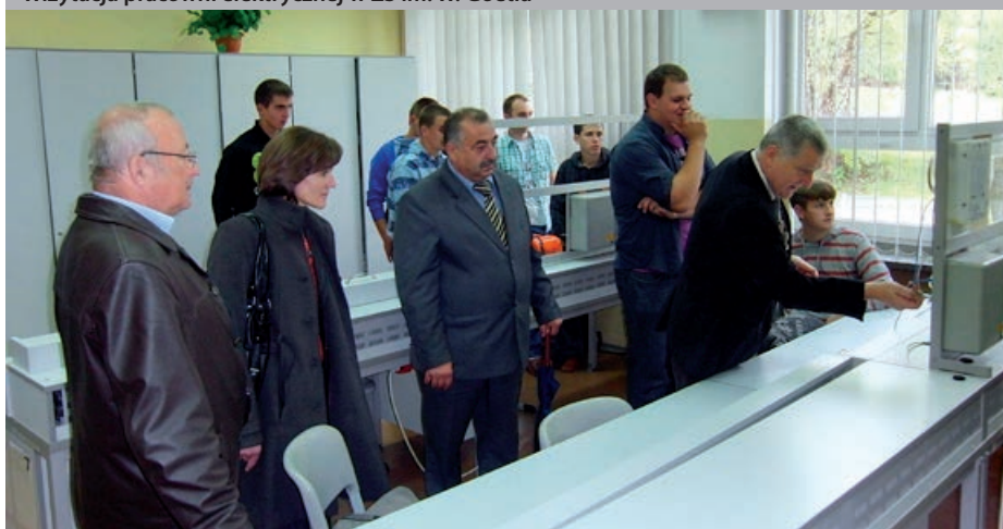
Wizytacja pracowni elektrycznej w ZS im. W. Goetla

Projekt koordynuje Wydział Edukacji i Zdrowia Starostwa Powiatowego w Suchej Beskidzkiej.