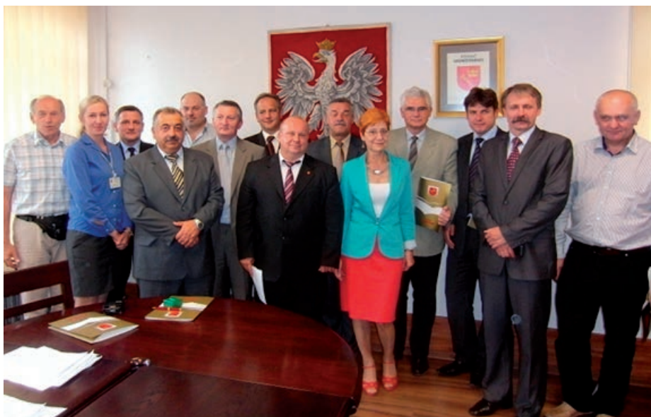
Uczestnicy spotkania w Nowym Targu

wspólnej kampanii promocyjnej na rynku polskim i europejskim w ramach którego powstaną tradycyjne wydawnictwa, przewodniki, mapy, foldery tłumaczone na języki obce oraz stworzenie spójnej oferty w sieci internet z możliwością pobierania przygotowanych i przetłumaczonych opracowań, aplikacji na urządzenia mobilne. Na potrzeby prowadzenia działań promocyjnych planowany jest zakup mobilnych scen z zadaszeniem i nagłośnieniem, zaprojektowanie i wykonanie modułowych stoisk wystawienniczych, przeprowadzenie badań potencjału turystycznego regionu.