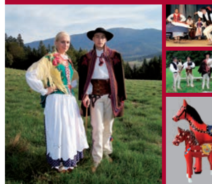
Cultural Heritage of Podbabiogórza. Traditions and Folklore Kultúrne dedičstvo Podbabiogórza. Tradície a folklór

nictwa, etnografią, sztuką ludową, tradycyjnymi obrzędami i folklorem podbabiogórskich miejscowości. Obie te pozycje zostały wydane w nakładzie 1500 egzemplarzy i mają swoje wersje językowe: angielską i słowacką (film napisy a album streszczenia). Zgodnie z założeniami projektu trafiły m.in. do wszystkich szkół, bibliotek i ośrodków kultury na terenie powiatu suskiego, a także do najważniejszych bibliotek w kraju i niektórych uczelni wyższych. Powinny stać się ważną pomocą dydaktyczną przy zajęciach poświęconych tożsamości kulturowej i regionalizmowi. Będą również pomocne przy promocji dziedzictwa naszego regionu.