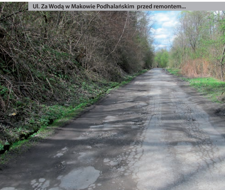
Ul. Za Wodą w Makowie Podhalańskim przed remontem...