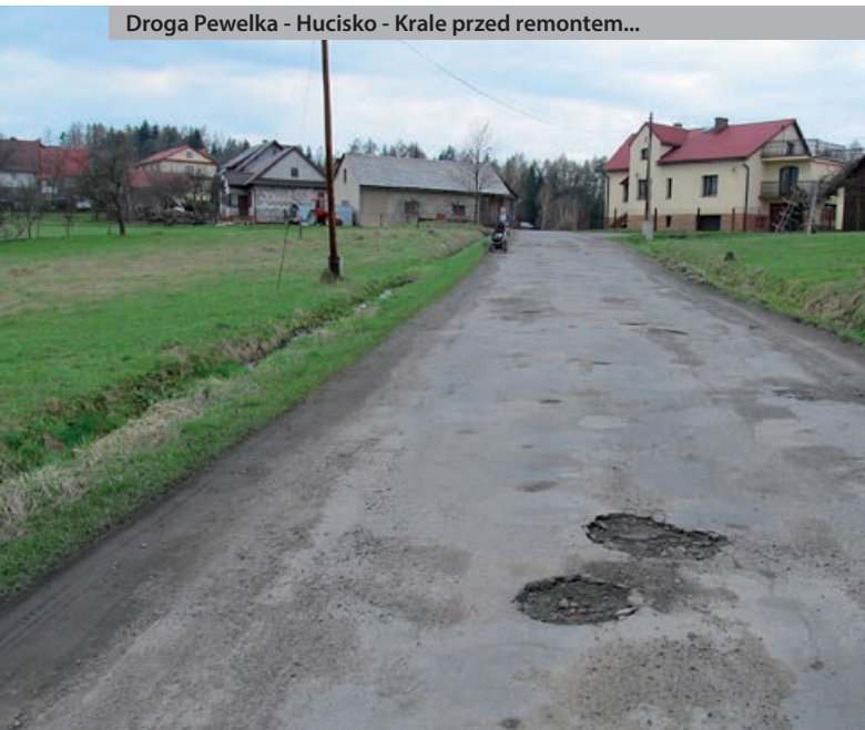
Droga Pewelka - Hucisko - Krale przed remontem...