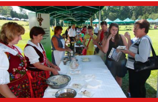
Słowackie specjały w Bieńkówe...

biogórskiej kuchni regionalnej. Występ zespołu oraz degustacja potraw regionalnych, zostały przyjęte bardzo ciepło przez licznie zgromadzoną publiczność.