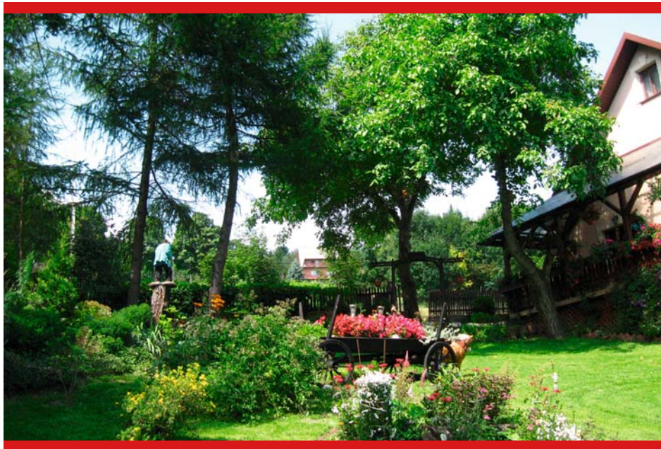
Ogród Urszuli Toczek