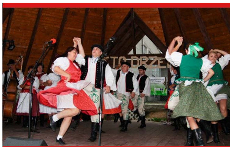
Zespół „Rosička, rosa” – 10 lipca 2011, Sidzina

Od 1 maja Wydział Kultury, Kultury Fizycznej, Turystyki i Promocji w Starostwie Powiatowym w Suchej Beskidzkiej, we współpracy ze słowackim Związkiem Babia Hora, realizuje projekt „Pakiet Babiogórski – blok działań wspierających popularyzację i ochronę dziedzictwa kulturowego Podbabiogórzka”. W ostatnich miesiącach w ramach projektu miało miejsce kilka prezentacji folklorystycznych podczas imprez, odbywających się po obu stronach Babiej Góry, odbyły się także warsztaty na Słowacji.