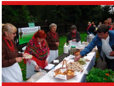
...i polskie w Oravskiej Polhorze (Rabčicach)

Również w ramach projektu w dniach 29–30.08.2011 r. na terenie słowackich miejscowości, położonych po południowej stronie Babiej Góry, odbyły się warsztaty, połączone z wy-