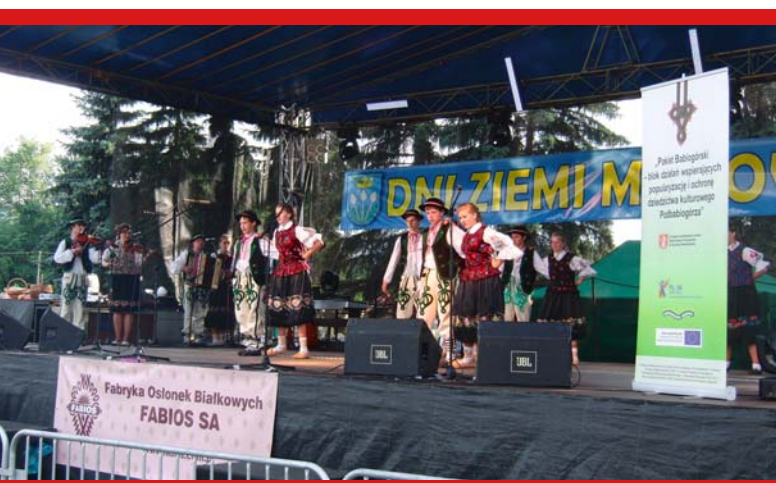
Zespół „Kamenčan” – 19 czerwca 2011, Maków Podhalański