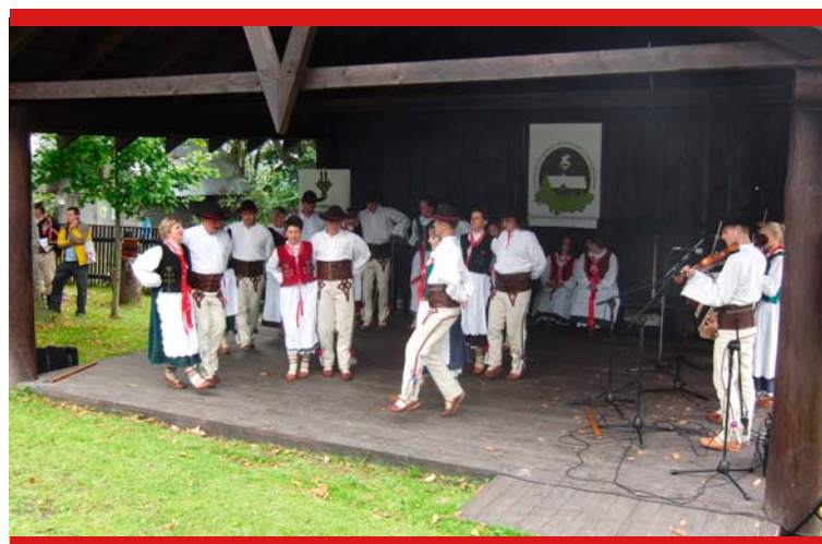
Zespół „Zbyrcok” – 28 sierpnia 2011, Oravska Polhora (Rabčice)