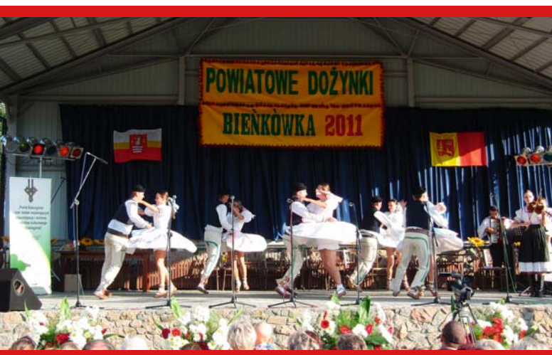
Zespół „Oravan” – 4 września 2011, Bieńkówka

28 sierpnia zespół regionalny „Zbyrcok” z Juszczyzna wystąpił podczas imprezy folklorystycznej 18. Ročník Rabčická Heligónka w słowackiej Oravskiej Polhorze (Rabčicach). W imprezie wzięły także udział panie z Suskiego Stowarzyszenia Kobiet „Samopomoc” w Suchej Beskidzkiej, które serwowały zebrany przy estradzie gościom smakowite specjały podba-