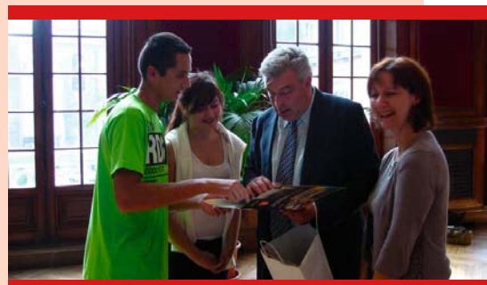
Uczestnicy Letniego Uniwersytetu przekazują materiały promocyjne powiatu suskiego burmistrzowi Boulogne-sur-Mer

Francuzi przygotowali dla swych młodych gości z całej Europy wiele atrakcji, profesjonalne lekcje języka francuskiego i mnóstwo spo-