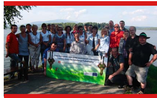
Uczestnicy warsztatów na Słowacji

jazdem studyjnym, w których wzięło udział 45 osób, w tym 20 osób reprezentujących stronę słowacką i 25 osób z terenu powiatu suskiego, wśród których znaleźli się przedstawiciele instytucji kultury, stowarzyszeń i zespołów regionalnych, działających na Podbabiogórz. Głównym celem warsztatów była wymiana doświadczeń i zapoznanie się z podobieństwami i różnicami w działalności kulturalnej po obu stronach babiogórskiej granicy oraz nawiązanie bliższych kontaktów i zacieśnienie wzajemnej współpracy. W programie warsztatów, przygotowanym przez słowackich gospodarzy wspólnie z Wydziałem Kultury, Kultury Fizycznej Turystyki i Promocji suskiego starostwa, znalazły się m.in.: wizyta w nowym Centrum Kultury