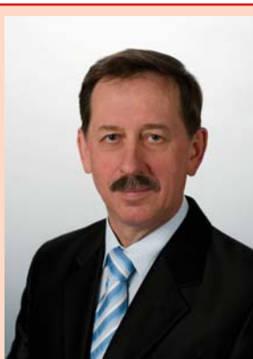
ANDRZEJ PAJAK – Starosta Suski

Jeszcze tytułem uzupełnienia. W tym dniu (24.11.2010 r.) po południu miałem telefon od jednego pana z propozycją „spotkania z naszymi radnymi, jeśli miałbym ochotę”. Nie odpowiedziałem na taką propozycję ani „tak”, ani „nie”.