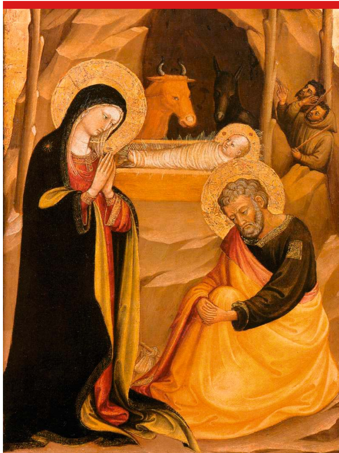
BICCI DI LORENZO „Narodzenie Pańskie”