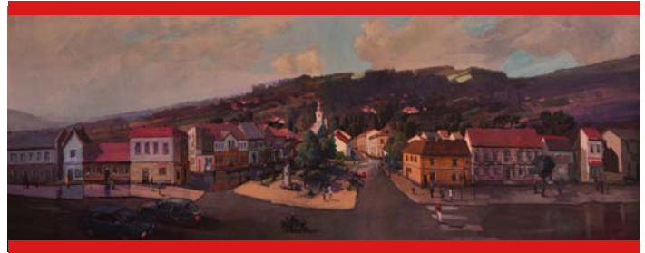
Panorama miasta Maków Podhalański. Autor: Piotr Machinek z Tych