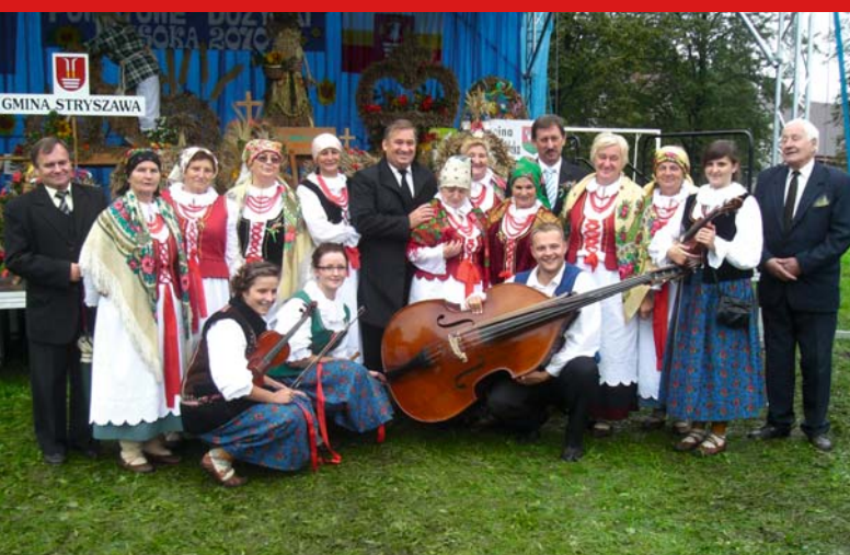
Koło Gospożyn Wiejskich Zawoja Dolna