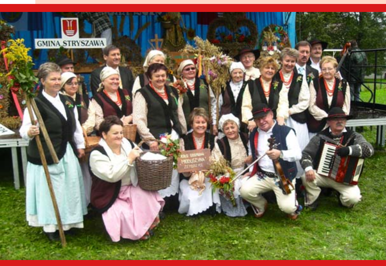
Koło Gospożyn Wiejskich Zembrzyce