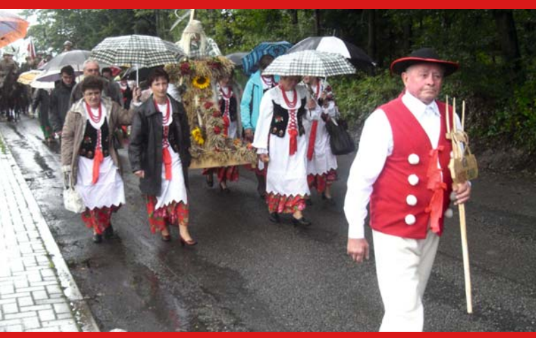
Koło Gospożyn Wiejskich Hucisko-Pewelka