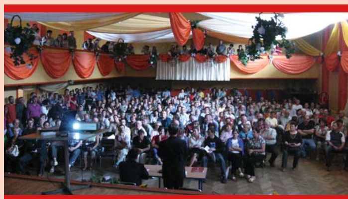
Spotkanie w Jordanowie

W okresie 08–16.09.2009 r. w 6 miejscowościach (Sucha Beskidzka, Maków Podhalański, Jordanów, Zembrzyce, Zawoja, Stryszawa) odbyły się spotkania z mieszkańcami powiatu – uczestnikami „Programu zwiększania wykorzystania odnawialnych źródeł energii i poprawy jakości powietrza w obrębie obszarów Natura 2000, powiatu suskiego”.