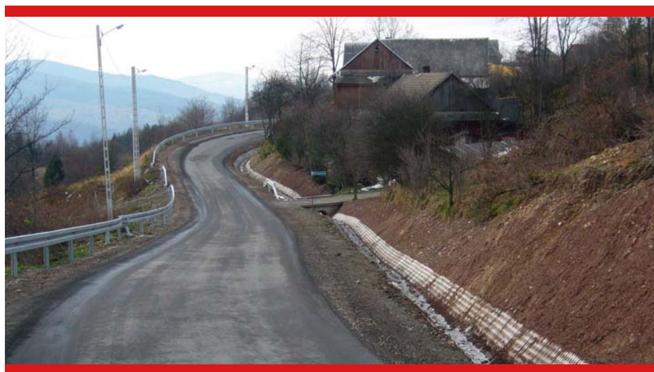
Fragment odnowionej nawierzchni drogi wykonanej w ramach usuwania skutków osuwiska w Osielcu.

W ramach tego zadania wykonano również zagospodarowanie terenów poscaleniowych poprzez wybudowanie dróg transportu rolnego, na co pozyskano środki w kwocie 1 247 479 zł, które zostały wykorzystane w 2008 roku. Łączna wartość pozyskanych dotacji na zadania związane ze scaleniem wyniosła 1 861 649 zł .