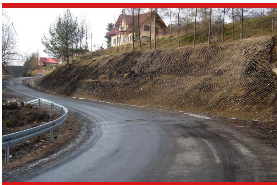
Wykonane prace zabezpieczające korpusu drogi na osuwisku w Osielcu

Na zakończenie można by się pokusić o zsumowanie wszystkich pozyskanych środków, przeliczając je na głowę mieszkańca, ale poza wymiarem czysto statystycznym trudno będzie na tej podstawie wyciągnąć głębsze wnioski. Biorąc zaś pod uwagę zakres zadań, za które Powiat jest odpowiedzialny, tj. m. in. edukacja, zdrowie, pomoc niepełnosprawnym, przeciwdziałanie bezrobociu, Powiat dobrze wywiązał się ze swoich obowiązków, pozyskując w ciągu ostatnich lat dodatkowe środki z funduszy unijnych, które trafiły bezpośrednio do mieszkańców powiatu i stanowiły w wielu przypadkach znaczące wsparcie.