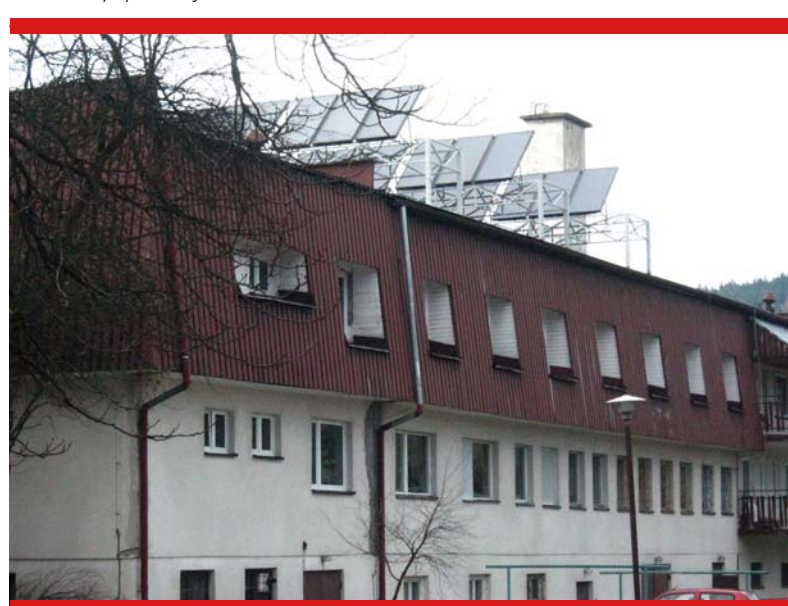
Dom Pomocy Społecznej w Łętowni