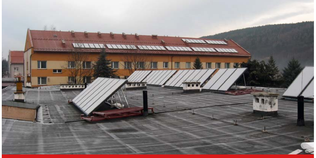
Zespół Szkół im. W Witosa w Suchej Beskidzkiej