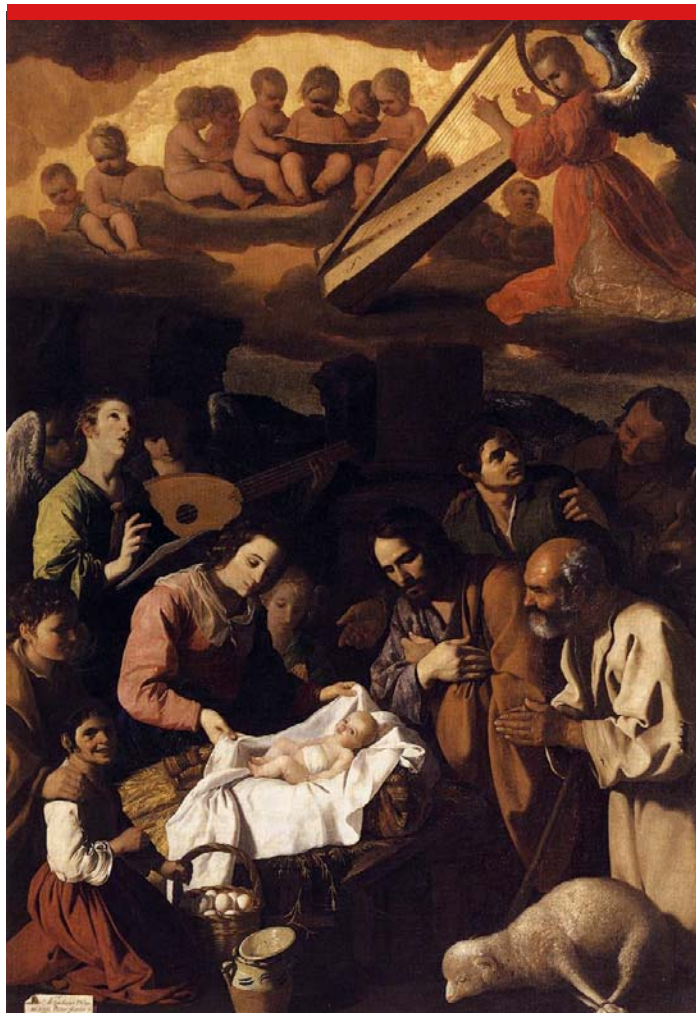
Francisco de Zurbarán „Adoracja pasterzy”

Z okazji nadchodzących Świąt Bożego Narodzenia składam wszystkim Mieszkańcom powiatu suskiego najserdeczniejsze życzenia zdrowia, rodzinnego szczęścia i wielu sukcesów w życiu osobistym i zawodowym. Oby błogosławieństwo Bożego Dzieciątka pozostawało z Państwem podczas tych szczególnych Dni oraz w całym nadchodzącym 2009 Nowym Roku.