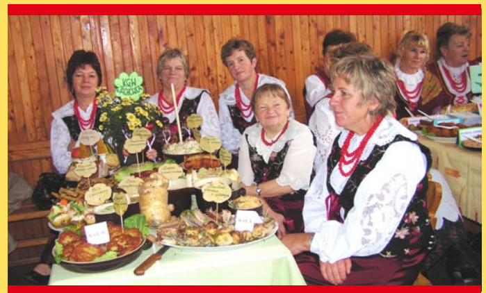
Panie z KGW Jachówka