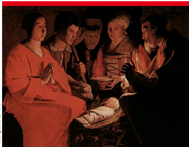
Georges de La Tour

Niech ta mała Boża Dziecina, która nawiedziła nas w tą grudniową noc, pozostanie z nami przez cały 2008 rok. Niech sprawi, że będzie on pogodny, radosny i szczęśliwy dla każdego mieszkańca powiatu suskiego. Z całego serca wszystkim mieszkańcom powiatu takiego roku 2008 życzy