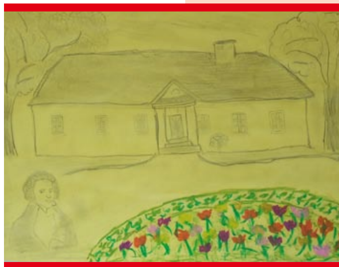
Rysunek Sebastiana Radwana

Jak dzieciństwo niewinnością Białe róże w sadzie rosną Strumień płynie sobie z wolna W nim pluskają się gołębie Tysiąc różnych opowieści Jest zamkniętych w naszym dębie Czasem deszcz zapuka w okno Tęcza barwna wzrok porusza Potem światłość znów nastanie Rozświetlając mrok mej duszy O zachodzie słońce krwawe Swą czerwieńią plami chmury Ptaki co noc słodkim śpiewem Do snu tulą stare góry Gdzie ucichną wszelkie echa Trawy szepczą swe pacierze W ten czas las się cały budzi Już noc sen w opiekę bierze Tak jak ludzie przemijanie Gwiazdy giną tutaj właśnie Każda z nich zna swoją drogę Gdy się rodzi – inna gaśnie Tutaj dom rodzinny stoi Pośród drzew wyniosłych cieni Najpiękniejsze moje miejsce Na bezkresnej, szarej ziemi. . .